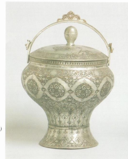
Ил. 5 Сосуд для бани. (сталь) Газни. Первая половина 20 в. Медь, позолота, резьба, чернение. Высота 32 см.