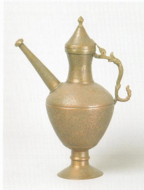
Ил. 4 Сосуд для воды. Газни. Первая половина 20 в. Медь, арабировка. Высота 38 см.