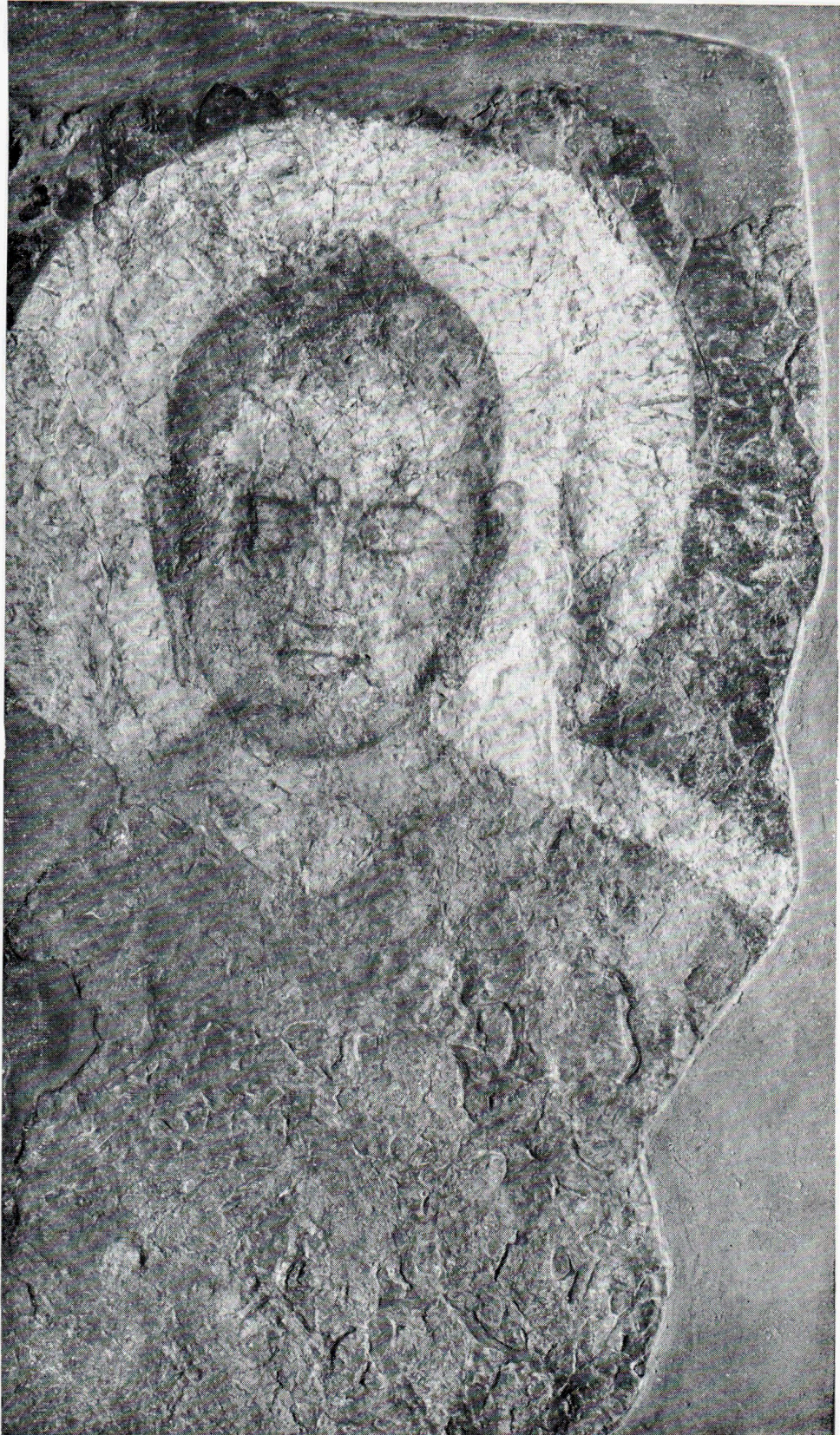
Голова Будды. Деталь стеной росписи в комплексе Г. ГЭ