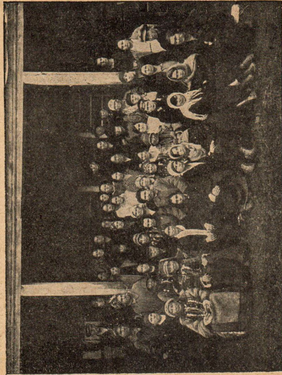
Рис. 1. Областной съезд женщин-членов сельсоветов Ойратской области. 1927 год, г. Ула.

бенно отрядным является факт роста участия в них ойраток (прирост свыше 30% за 1 год). На это указывает и следующее обстоятельство. В ноябре месяце 1925 года было впервые организовано делегатское собрание среди кочевых ойраток. Первоначально в него вошло лишь 6 человек, в том