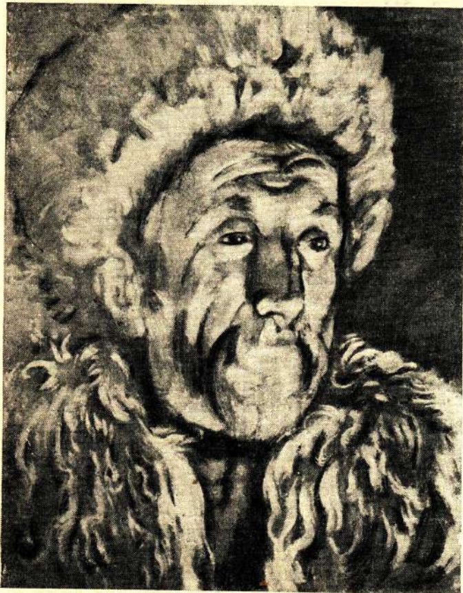
М. Джемал. Портрет поэта Гамзат Цадасса. Гуашь. 1932.

Многосторонние интересы художника заставляют его думать над новыми тематическими полотнами, и сейчас уже он собирает материал для картины из эпохи гражданской войны на Кавказе. „Смерть тов. Махача Дахадаева“ и задуманного в виде триптиха произведения на тему социалистической перестройки горных аулов, изживания феодально-патриархальных дореволюционных форм жизни.