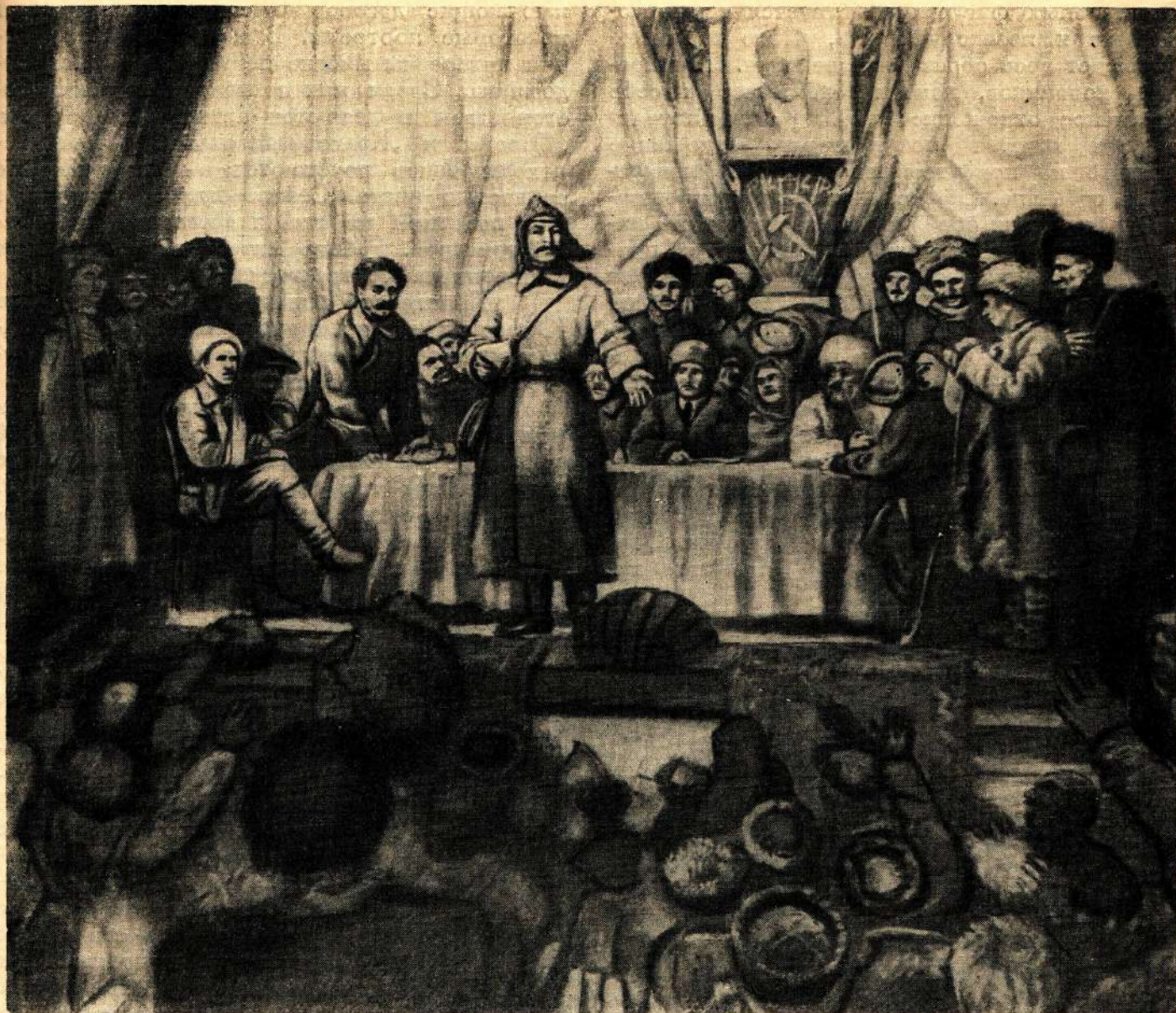
М. Джемал. Тов. Сталин объявляет автономию Дагестана. Эскиз. 1935.