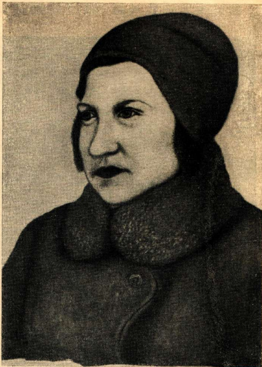
И. Акбаев. Портрет. Карандаш.

Большое внимание партийных и советских руководителей края к художникам и их творчеству, особенно ярко проявившееся во время выставки, намеченная союзом советских художников Северо-Кавказского края, организация студий и другие мероприятия несомненно обеспечат еще больший размах художественного творчества и дальнейший расцвет социалистиче-