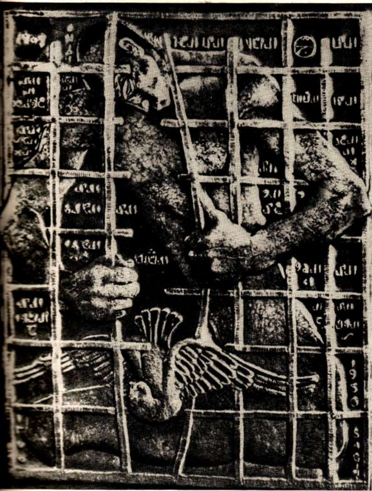
Гамаль ас-Сагини. Свобода. Медь. 1956. Gamal as-Sagini. La liberte. Cuivre. 1956.