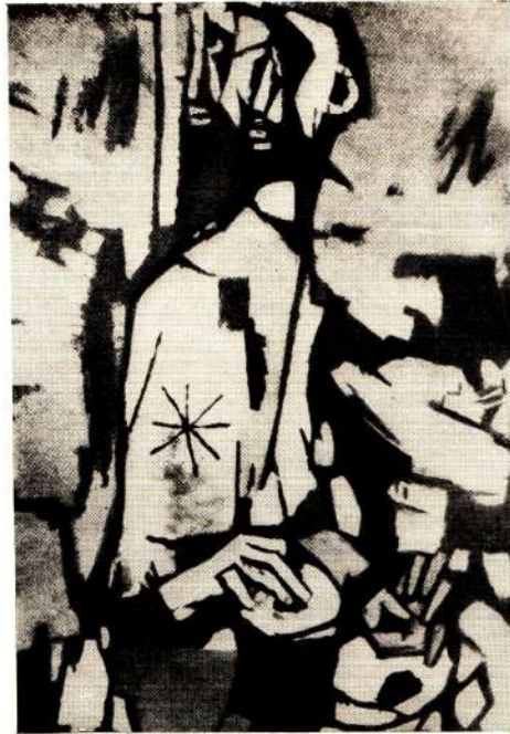
Магбул Хусейн. Оборванец. Масло.

Amrita Sher-Gil. June fille de village. Huile.