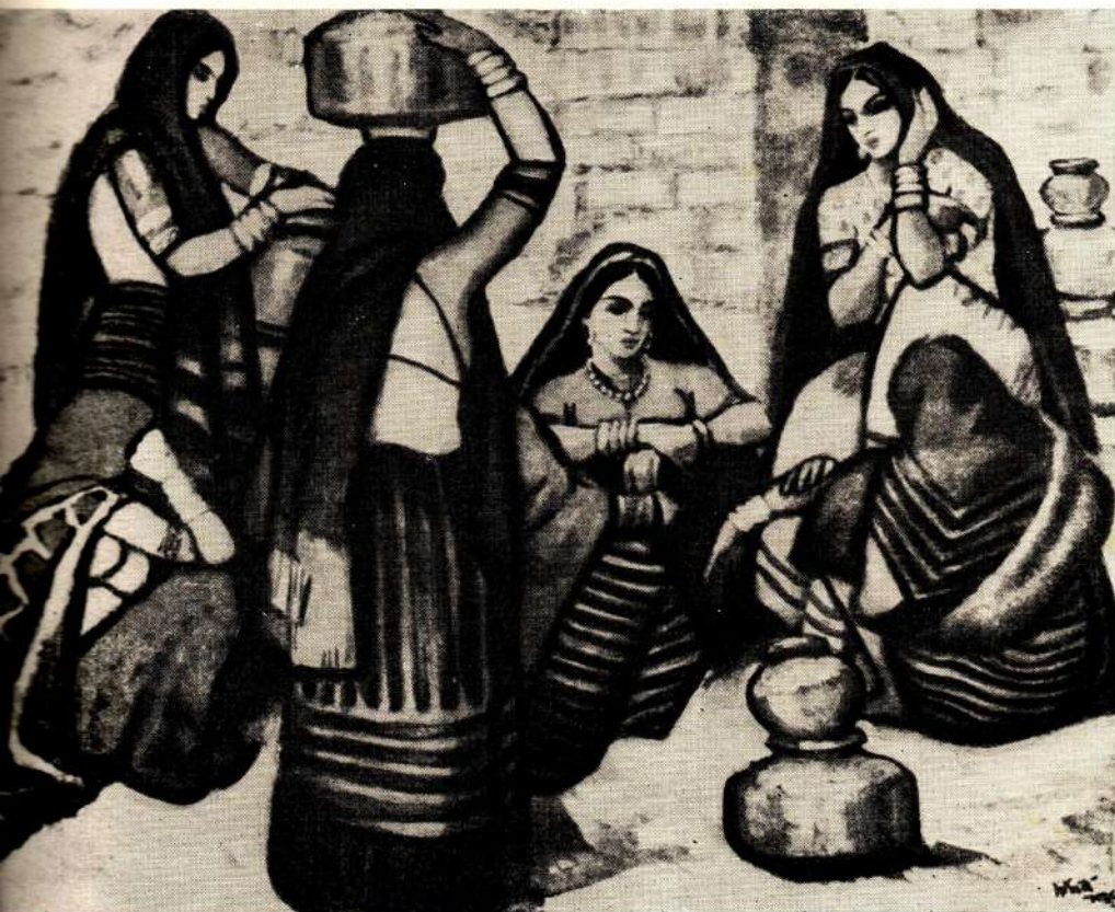
Мадхава Сатвалекар. Разговор на дороге. Масло.

Наряду с произведениями художников-реалистов я видел в городах Индии множество работ художников противоположных направлений. В Бомбее в конце 1963 года кроме большой выставки Бомбейского художественного общества, на которой