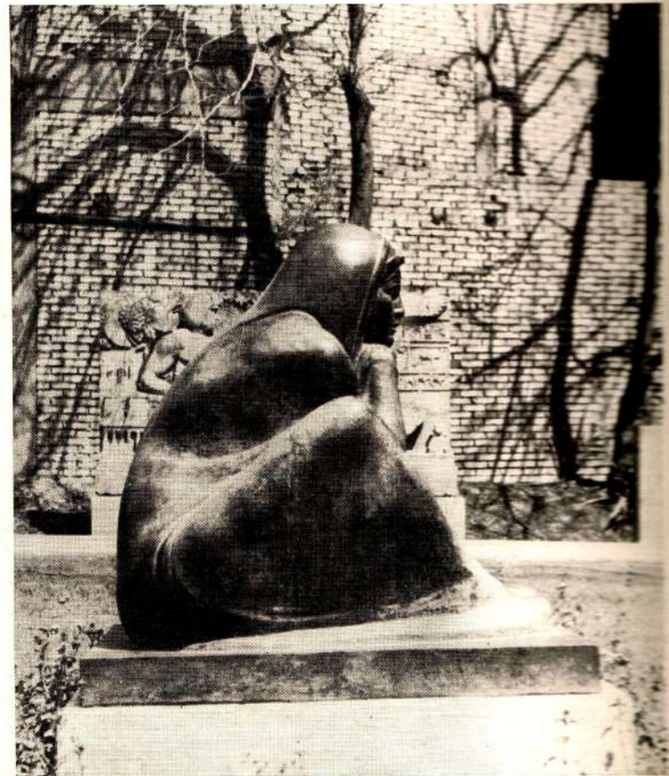
Махмуд Мухтар. Дочь Нила. Гранит. 1930-е годы.

му народности, обратившись к фольклору, к еще живым истокам народного прикладного и декоративного искусства. Его вдохновили узоры бенгальской керамики, а также народные лубочные картинки с их музыкальностью — певучими линиями и звучными аккордами цвета. Его исполненные темперой по холсту произведения («Предложение», «Сестры» и др.) отмечены чистотой и динамикой линий, ритмом фигур, интенсивностью цвета, узором композиции. Художник, восприняв по-