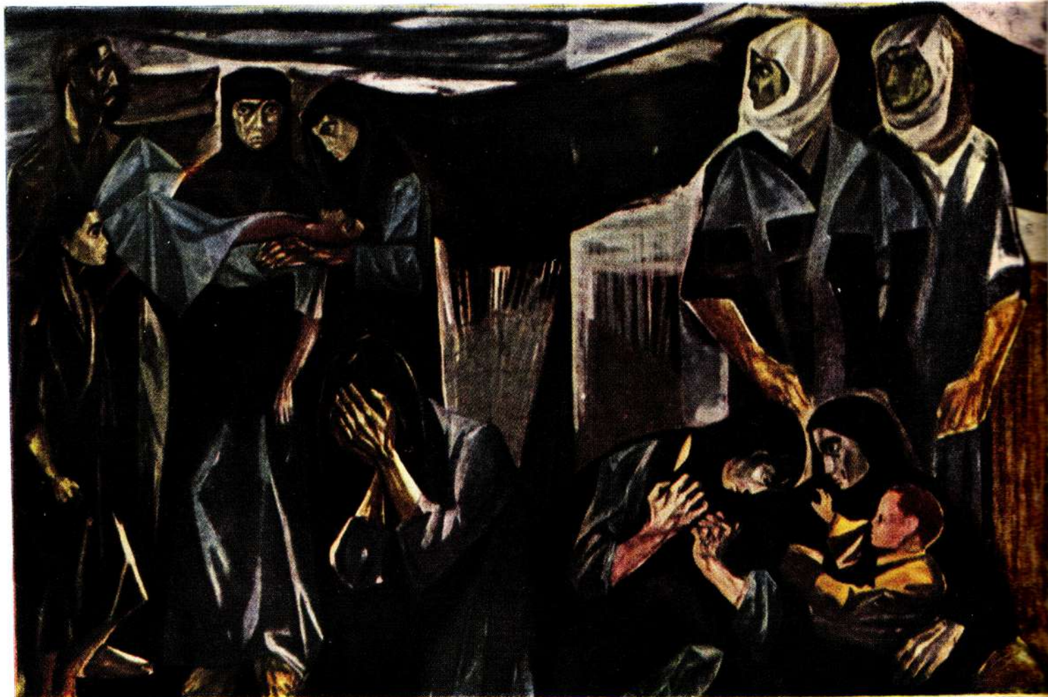
Mahmoud Sabri. La mort de l'enfant. Huile.