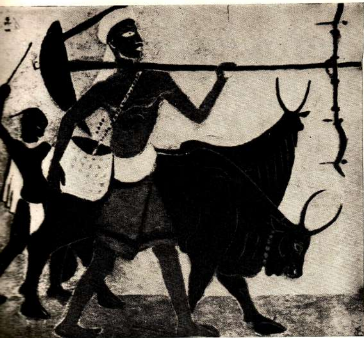
К. Кришна Хеббар. Хозяин земли. Масло. Середина 50-х годов. K. Kzishna Khebbar. Le maître de la terre. Huile. Vers 1955.