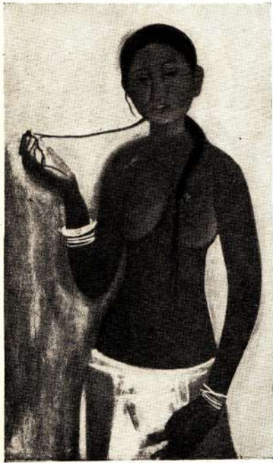
Амрита Шер-Гил. Деревенская девушка. Масло.

Amrita Sher-Gil. June fille de village. Huile.