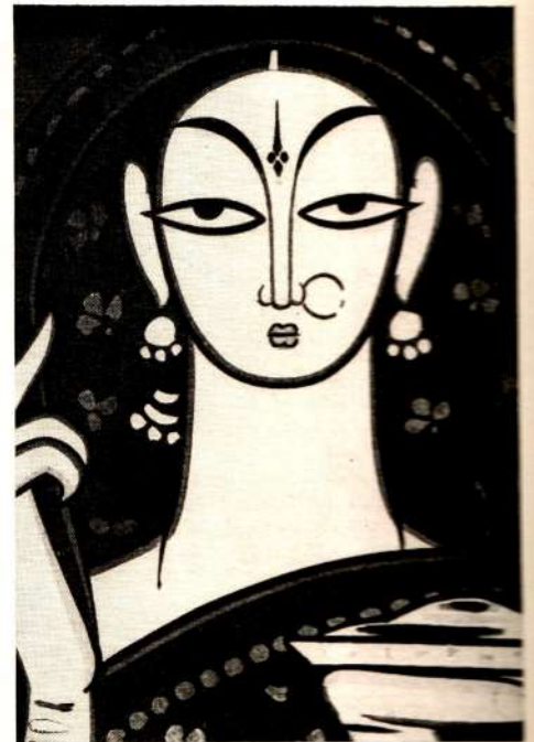
Джамини Рой. Предложение. Темпера.

Jamini Roy. La demande en mariage. Détrempe.