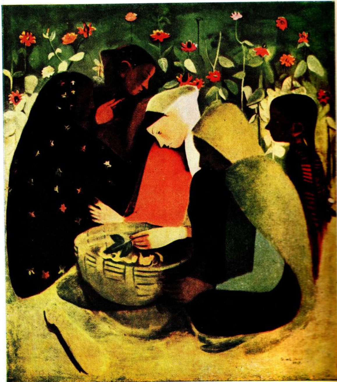
Амрита Шер-Гил. Отдых. Масло. 1938.