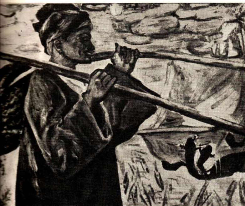
Мухаммед Наги. Рыбак. Масло. 30-е годы. Moukhammed Nagi. Le pêcheur. Huile. Les années 1930.

(1888—1956). Получив художественное образование в Париже и Флоренции, он воспринял некоторые тенденции импрессионизма, но, как говорил он сам, «возвратился от Моне к Мане» и остался убежденным реалистом. Многие свои произведения художник посвятил природе и людям Египта. Наги свойственны широкая и динамичная живописная манера, умение передать и использовать для характеристики изображенного яркое солнечное освещение. Образ человека у него получался живой, наделенный внутренней значительностью. Наги увлекла и монументальная живопись: он написал большое панно для больницы Моассе в Александрии, в котором жанр переплетается с аллегорическими мотивами.