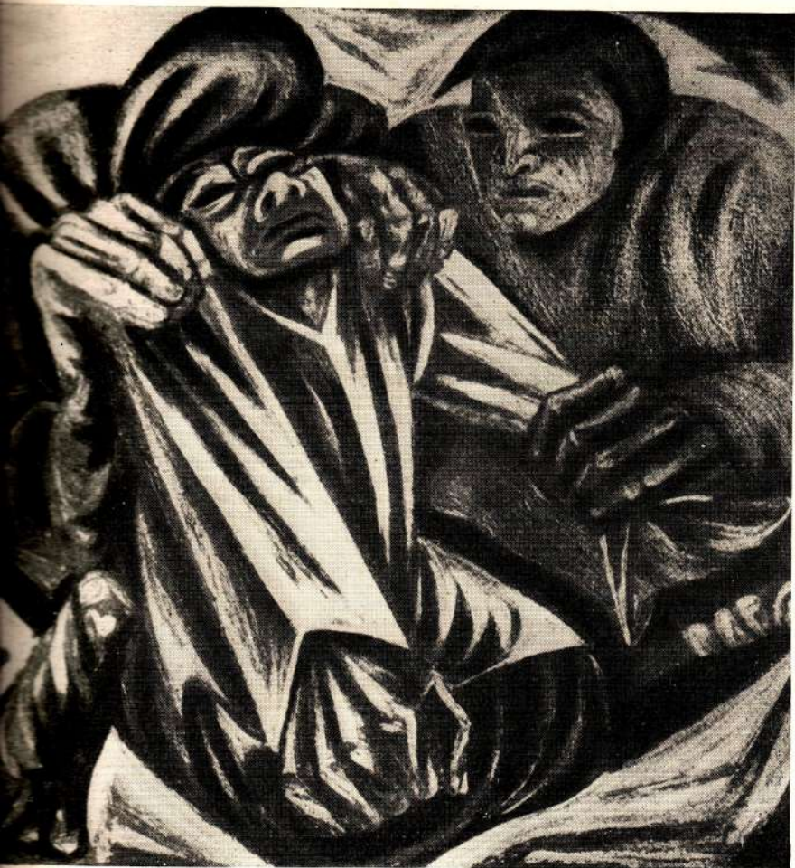
Сатиш Гуджрал. Отчаяние. Масло. Середина 1955-х годов.

Первым я назову выдающегося художника современной Индии К. Кришну Хеббара (род. 1912), живущего в Бомбее. После окончания художественной школы художник писал жанровые картины из жизни индийской деревни в традициях раджпутской миниатюры. Однако ищущую натуру Хеббара не удовлетворяет пассивная иллюстративность. Возможно, под обаянием творчества Амриты Шер-Гил он начал создавать лаконичные по форме, многофигурные композиции из жизни бедноты («Нищие», 1948, и др.). Поездка в Европу и продолжение учебы во Франции вызвали у художника интерес к формальным экспериментам в духе Матисса и Брака. Но он не стал подражателем европейских фовистов и кубистов. В 50-х годах Хеббар по-своему решает проблему народности в искусстве. Хранящаяся в Эрмитаже картина Хеббара «Круг за кругом», так же как полотно «Каменщики» и ряд других, характеризует интерес художника к трудовому ритму, который Хеббар передает очень экспрессивно и эмоционально. В этих качествах, а не только в сюжете, справедливо видят национальные черты его творчества.