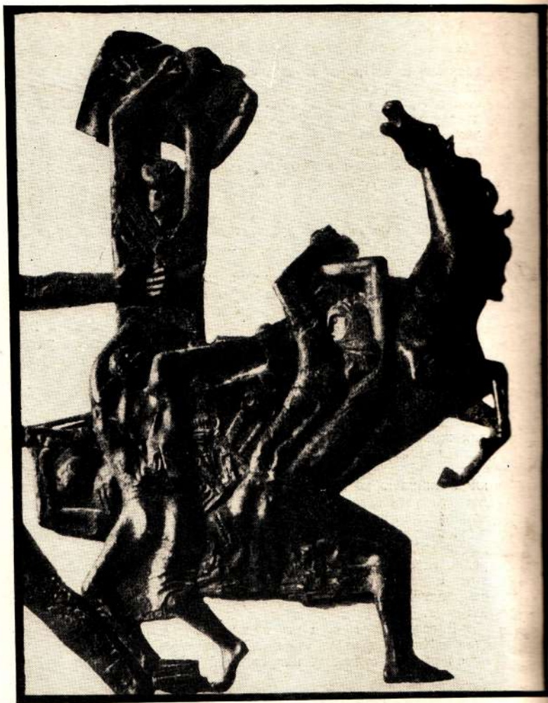
Джавад Селим. Ирак, вырвавшийся на свободу. Фрагмент монумента в Багдаде. Бронза. 1960.

Дж. Селим говорил, что «иракское искусство, как искусство любой страны мира, должно иметь гуманистический ха-