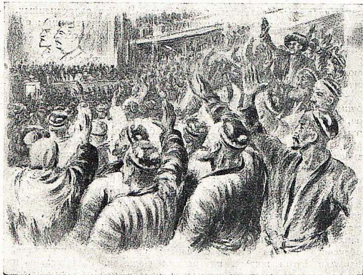
Л. Абдуллаев. Клятва. Автолитография. 1945.

Экспрессионизм, стилизаторство и другие проявления формализма были свойственны ранним работам М. Курзина, Усто-Мумина (А. Николаева) и некоторых других художников.