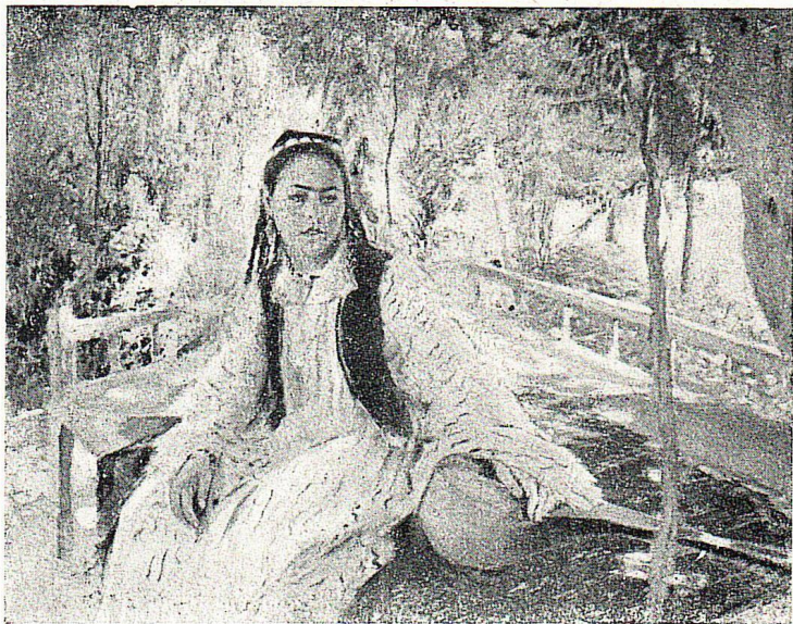
П. Бен'ков. Узбечка с дутаром. Масло. 1947.

1942 года, большая выставка, посвященная 25-летию Великой Октябрьской социалистической революции, выставка «Два года Великой Отечественной войны», выставка 1944 года и др.