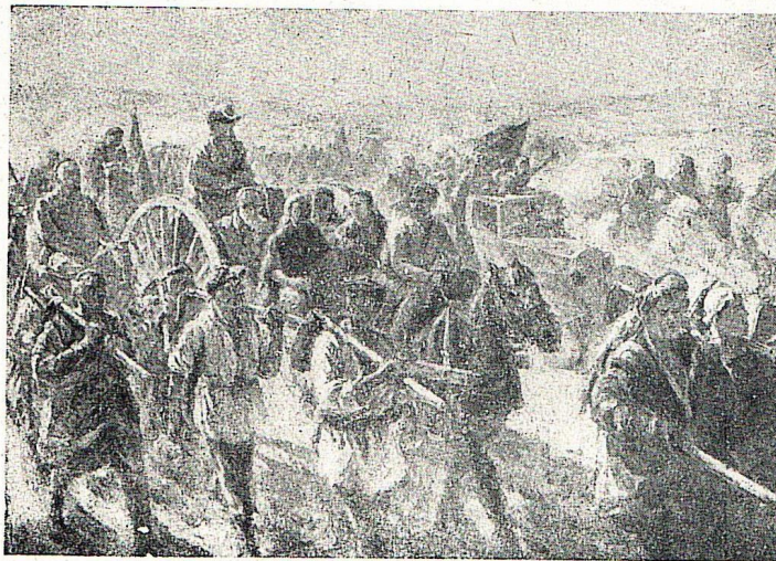
В. Уфимцев. На народную стройку. Масло. 1941.

Выставок было много, по несколько в год. Крупнейшие из них: оборонная 1941 года, военно-шефская и республиканская