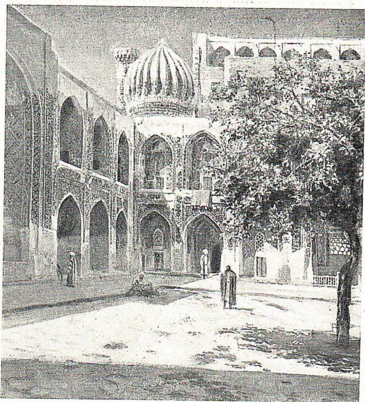
Л. Бурэ. Двор медресе Шир-дор в старой Бухаре. Масло.

Социалистическая революция сразу пробудила огромную тягу к искусству в среде широких народных масс. В 1919 году в Ташкенте при организации первого художественного училища было подано триста заявлений о приеме. В 1922 году создается специальный краевой мусульманский художественный техникум, привлечший более двухсот учащихся-узбеков. Правда, лишь немногие из учившихся в нем стали потом художника-