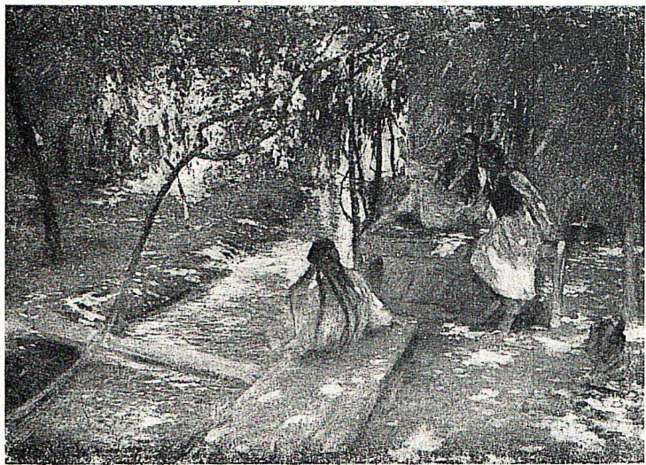
П. Бенков. Подруги. Масло. 1945.