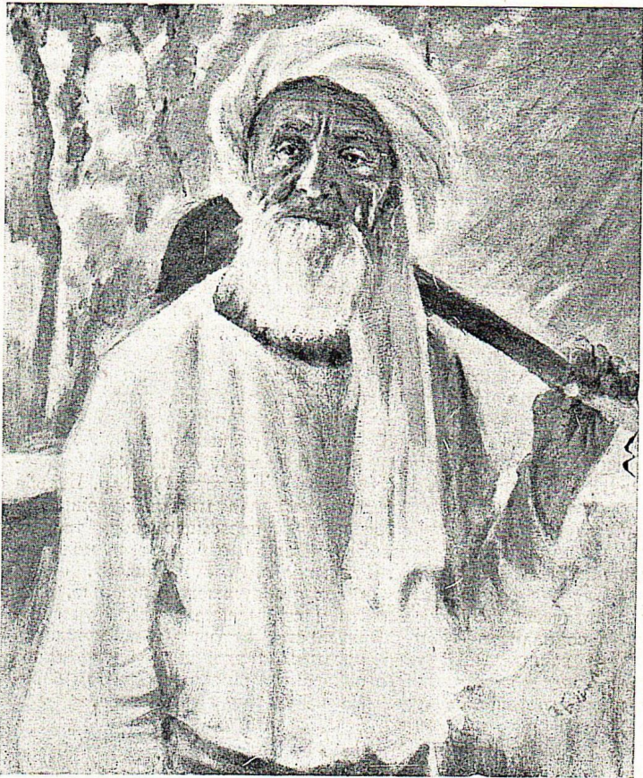
П. Беньков. Колхозник-ударник. Масло. 1940.

В 1935 году на 4-й республиканской выставке впервые с большой композиционной картиной выступил художник В. Уфимцев. «Героическая» изображает советских воинов эпохи