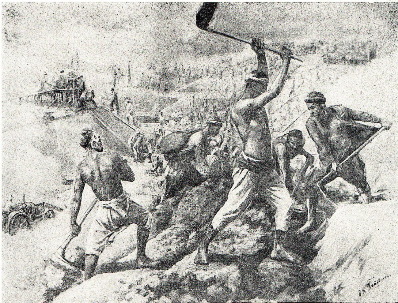
О. Татевосян. Строительство Ката-Курганского водохранилища. Масло. 1940.

гражданской войны. Несмотря на композиционные и живописные недостатки, эту вещь отличает внутреннее единство замысла, переданное выражениями изображенных лиц, и чувство романтической приподнятости. Художнику удалось наметить большой впечатляющий образ, но нехватало мастерства, чтобы его хорошо живописно выполнить.