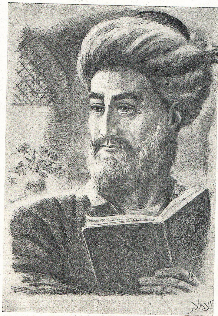
В. Кайдалов. Портрет Алишера Навои. Литография. 1940.