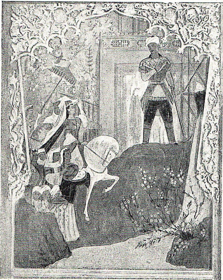
Ч. Ахмаров. Фархад и Ширин. Настенная роспись в зале Навои Узбекского театра оперы и балета в Ташкенте. 1947.

Рассвет искусства социалистического Узбекистана ценим не только мы, советские люди. Оно имеет международное значение. Для трудящихся зарубежного Востока жизнь советских республик — путеводный маяк в их борьбе с гнетом и бесправием.