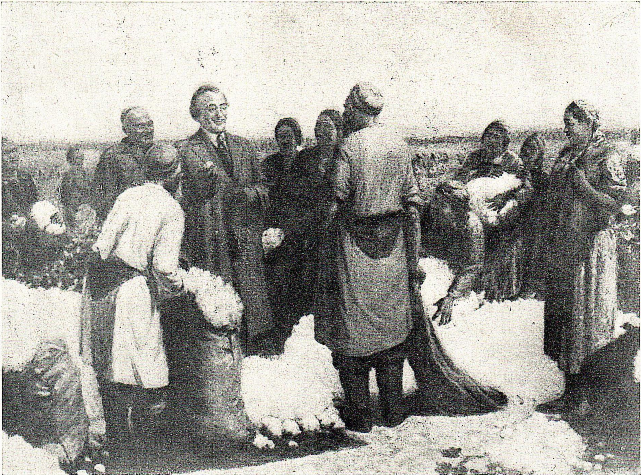
М. Аринин, В. В. Куйбышев на уборке хлопка в Узбекистане. Масло.

«В родном ауле» и другие пейзажно-жанровые вещи. Уже в этих вещах проявляются поэтичность и лиризм Тансыкбаева как художника. Эти чувства он воплощает в красочных сочетаниях, в общем красивом цветовом решении полотна.