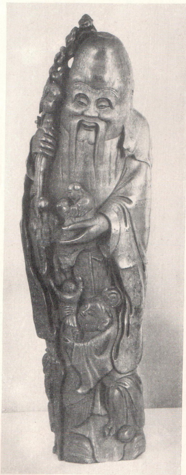
Фигура божества долголетия Шоу Сина с детьми. XIX в. Бамбук, резьба.