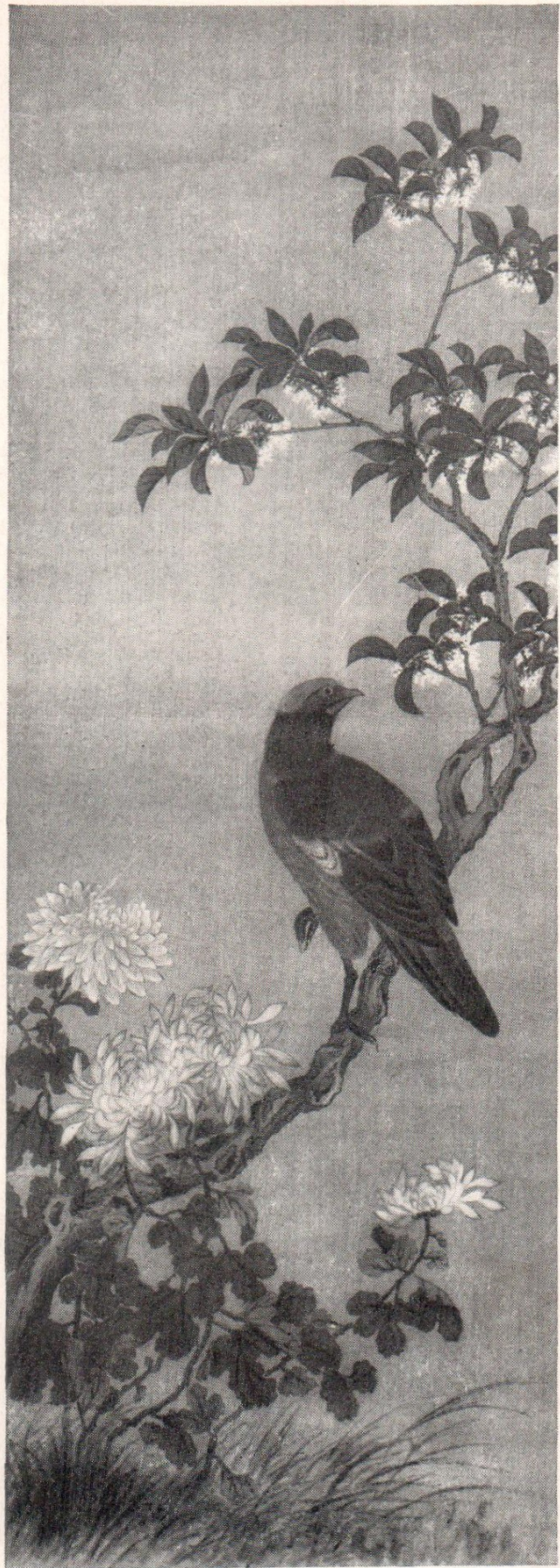
Шэнь Нань-пин. «Осень». XVII в. Свиток живописи на шелке.