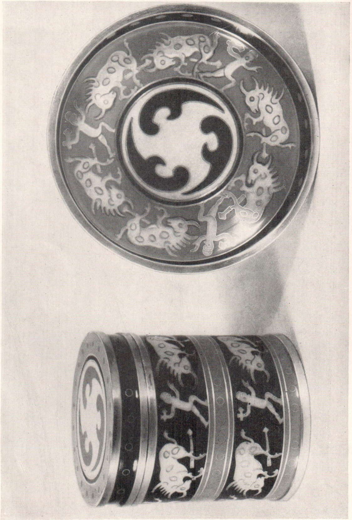
Курительный прибор. 1953 г. Перегородчатая эмаль.