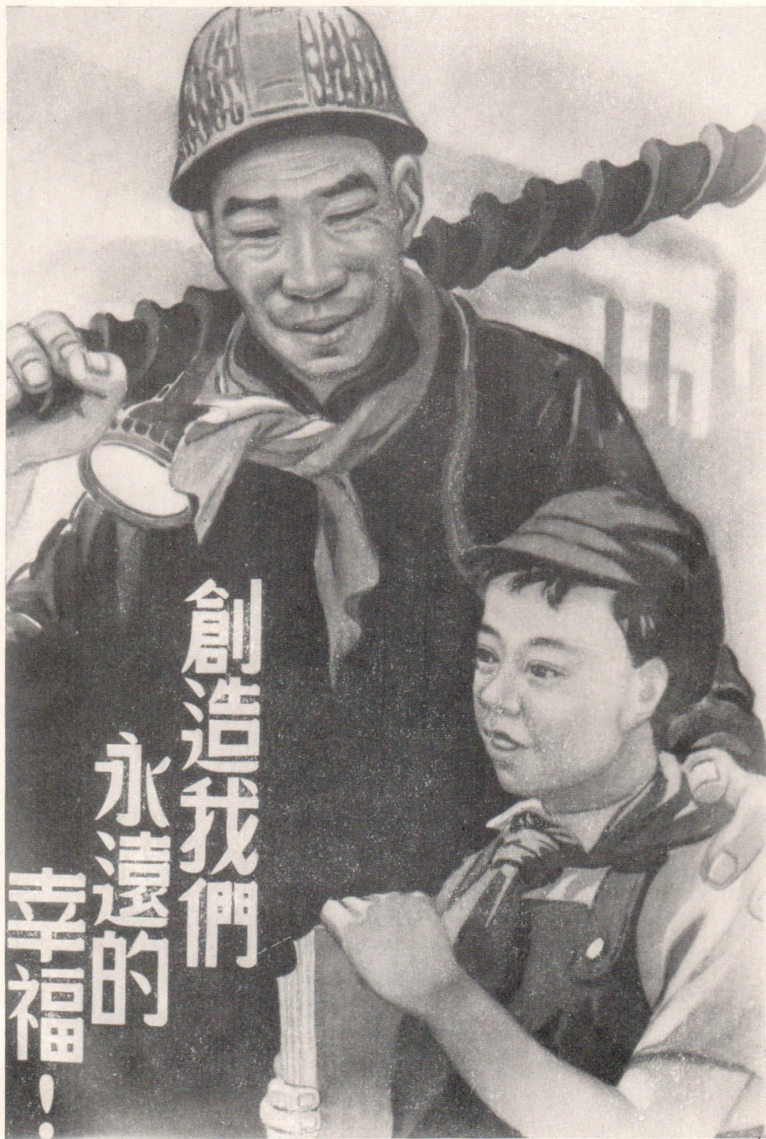
Чэн Син-хуа. «Построим наше счастье на века!» 1951 г. Плакат.