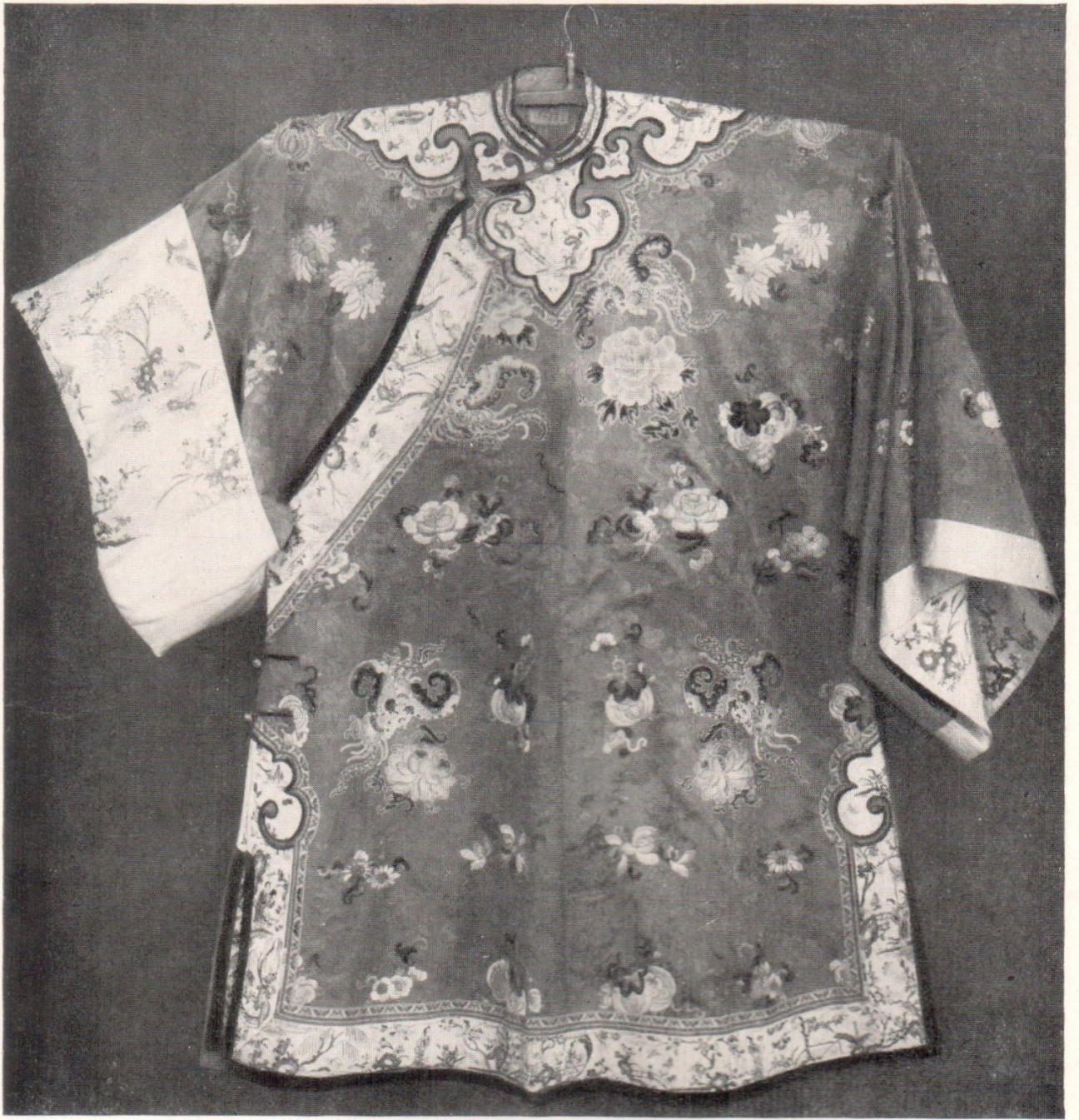
Женская кофта голубого шелка с вышивкой. XIX в.