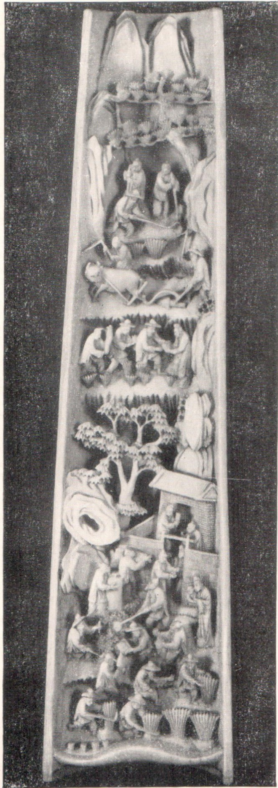
Подставка для руки каллиграф-а с изображением процессов земледелия. Конец XVIII — начало XIX в. Слоновая кость, резьба.