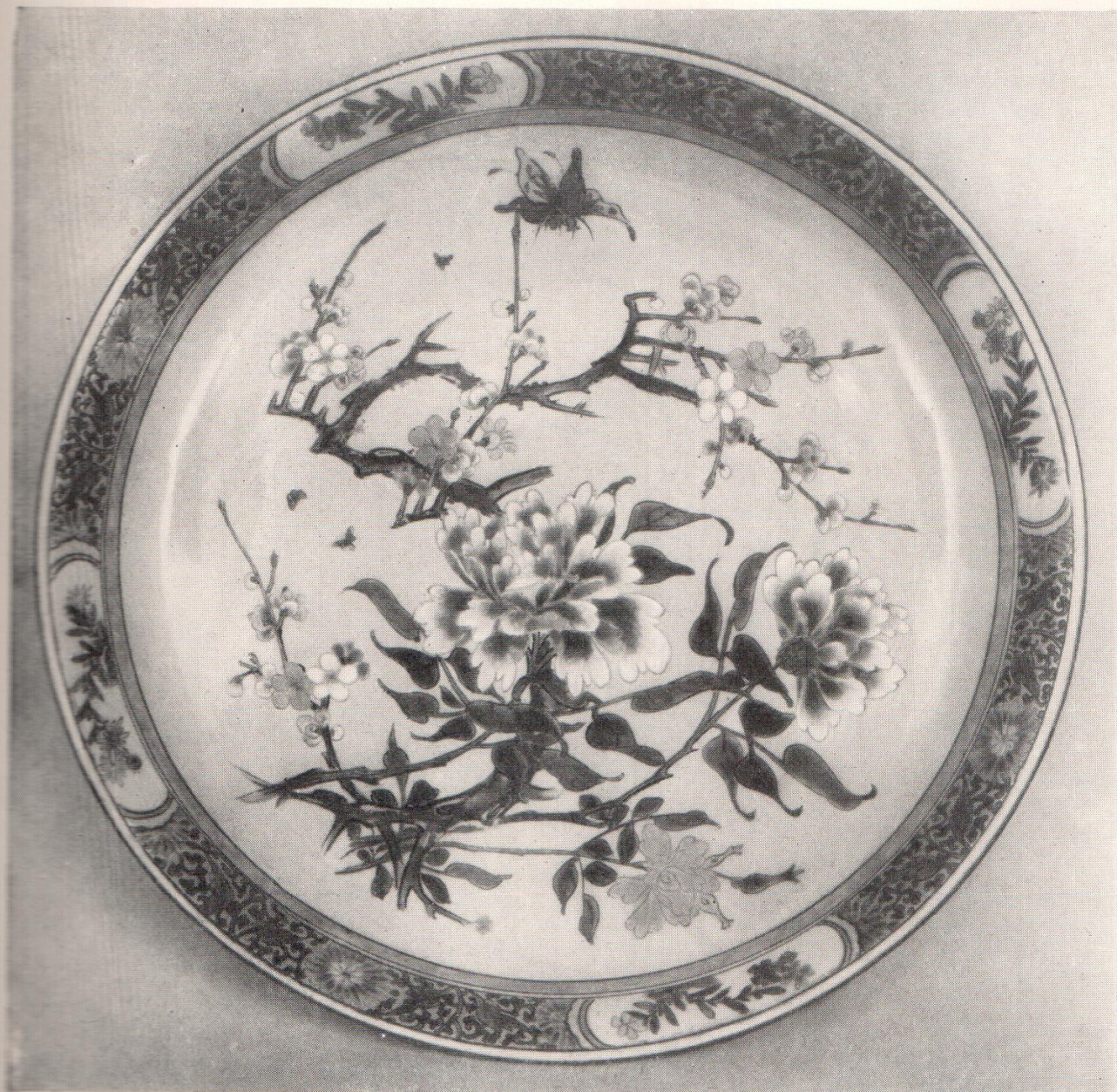
Блюдо с изображением цветов и бабочек. XIX в. Фарфор. Роспись эмалями и золотом.