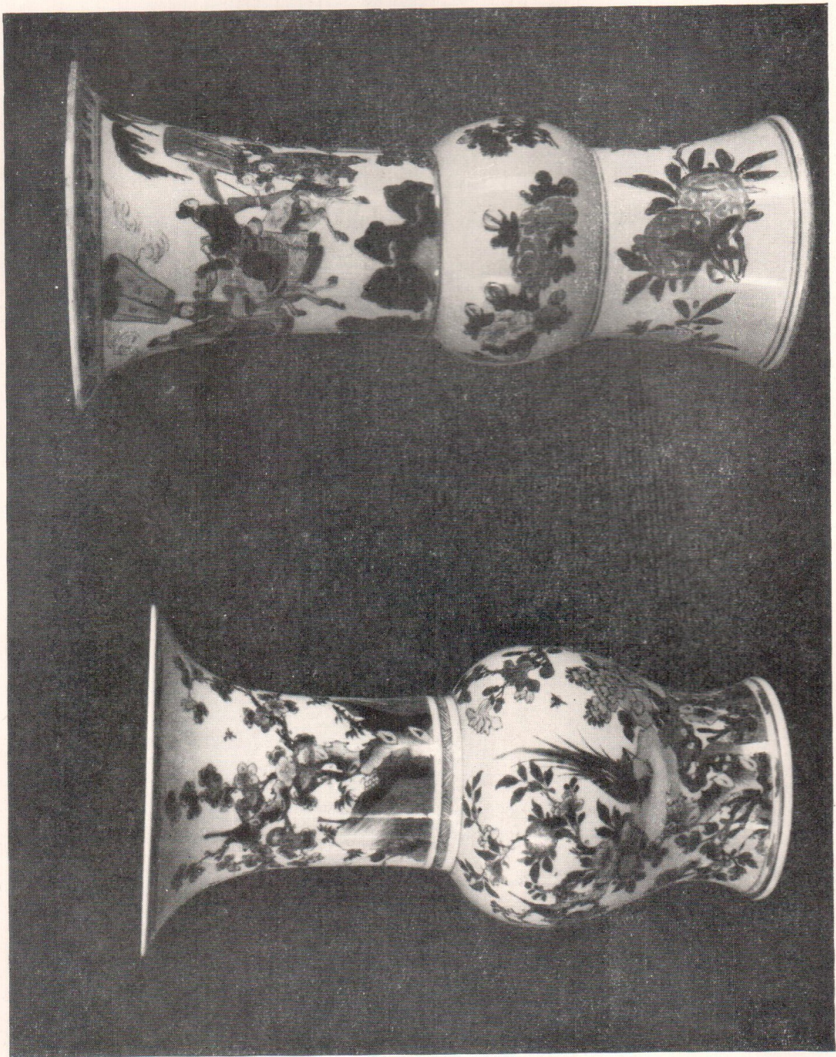
Вазы фарфоровые. XIX в. Роспись кобальтом и эмалью.