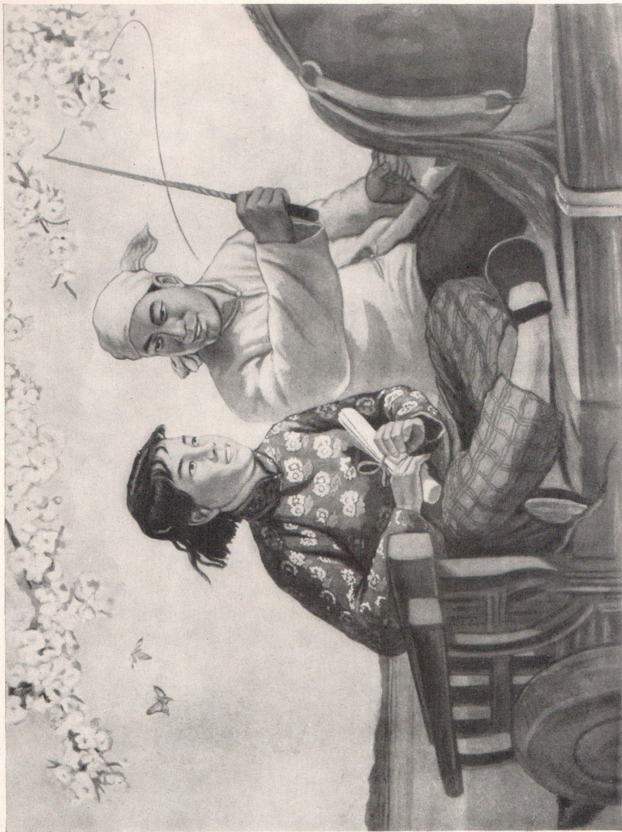
У Дэ-цзу. «После регистрации брака» 1953 г. Плакат.