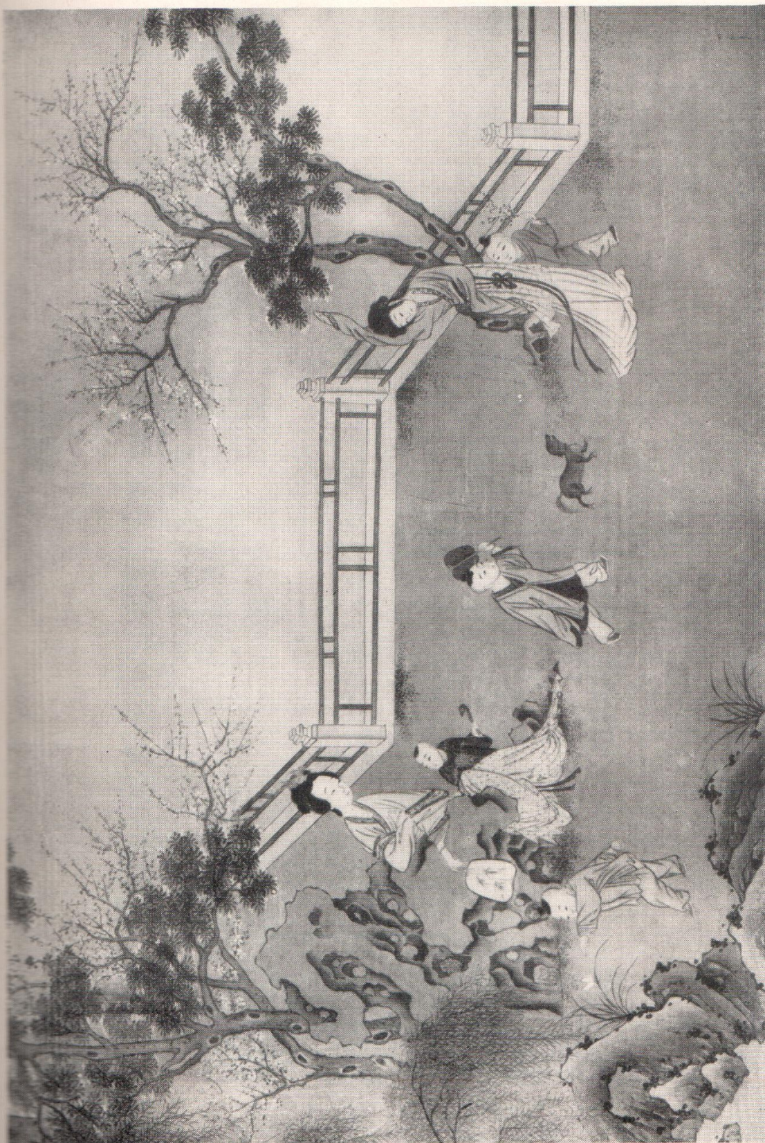
Цю Ин. «Женщины с детьми». XVI в. Свиток живописи на шелке.