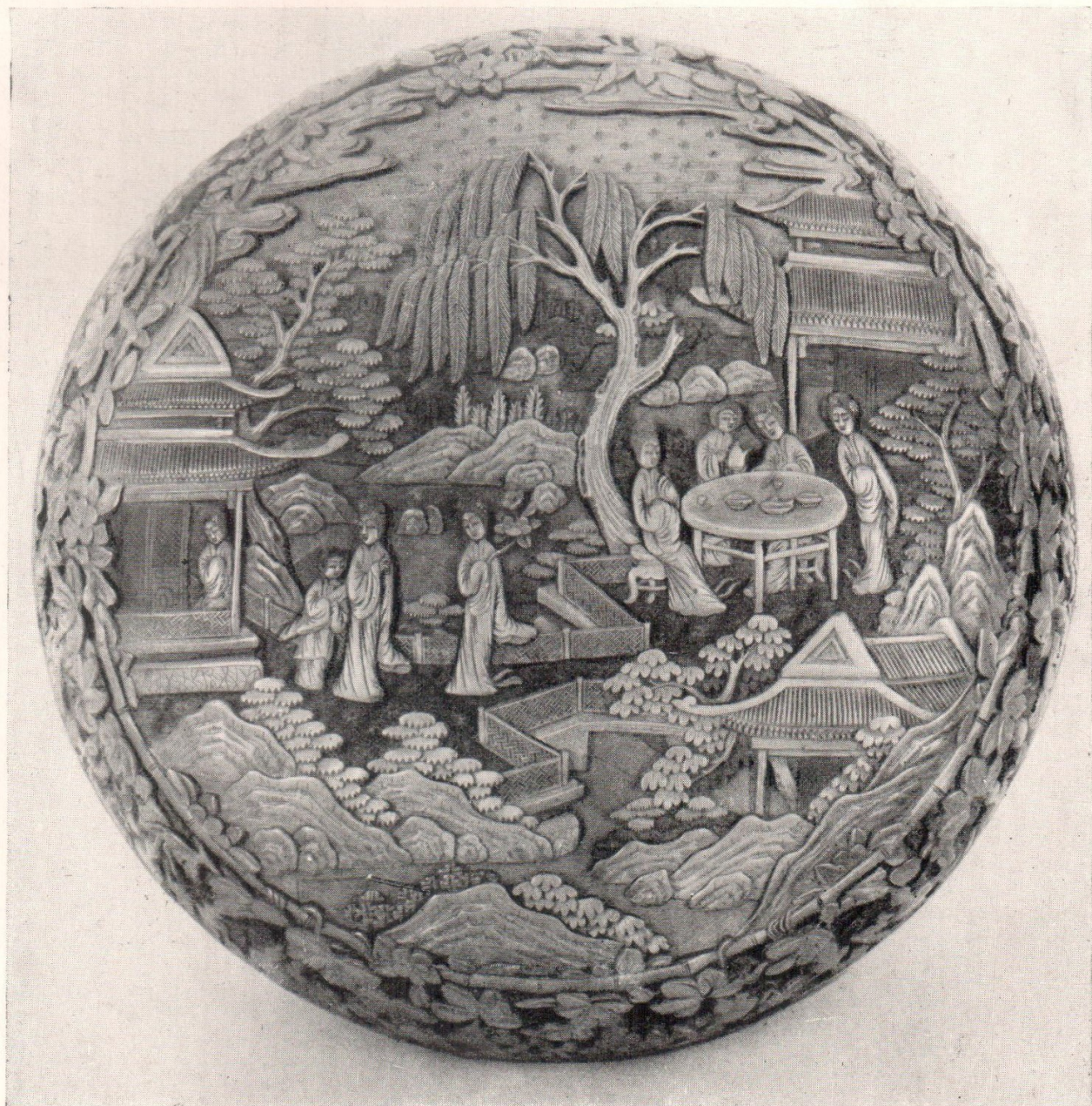
Коробка с изображением женщин в саду. XVII в. Красный резной лак.