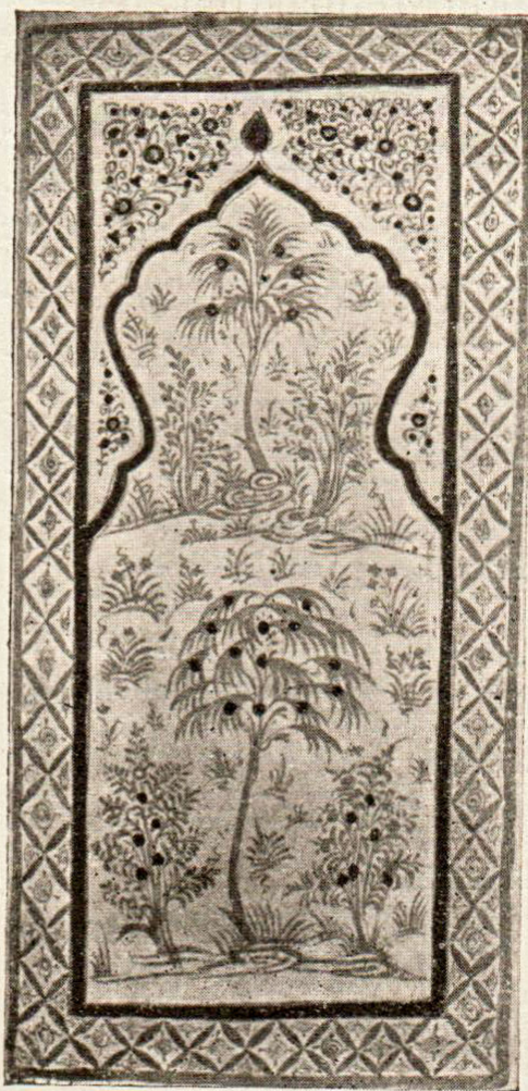
Рис. 1. Образец живописи мазара Биби-Ханым.

После смерти Тимура и временного упадка строительной деятельности, этот стиль живописи уступает место другому с прежними принципами усиления эффекта живописи, но с совершенно другими техническими и стилистическими подходами. На выставке представлены для сравнения три копии с живописи второго стиля (Ишрат Хана), и несколько фотографий (Ак-Сарай), где изменение фактуры стены достигается путем нанесения выпуклого узора способом т. н. «Кундаль» — особой массой «Кизыл-Кессака», наносимой кистью.