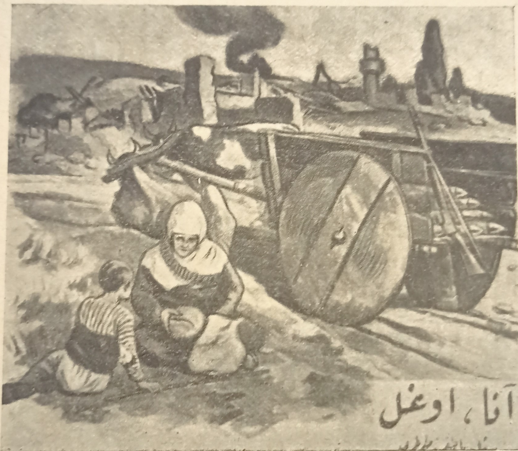
„Мать и сын“.

Введением в историю революционного движения в Турции являются диаграммы, дающие экономический и социальный базис движения („Сельское хозяйство Турции“,